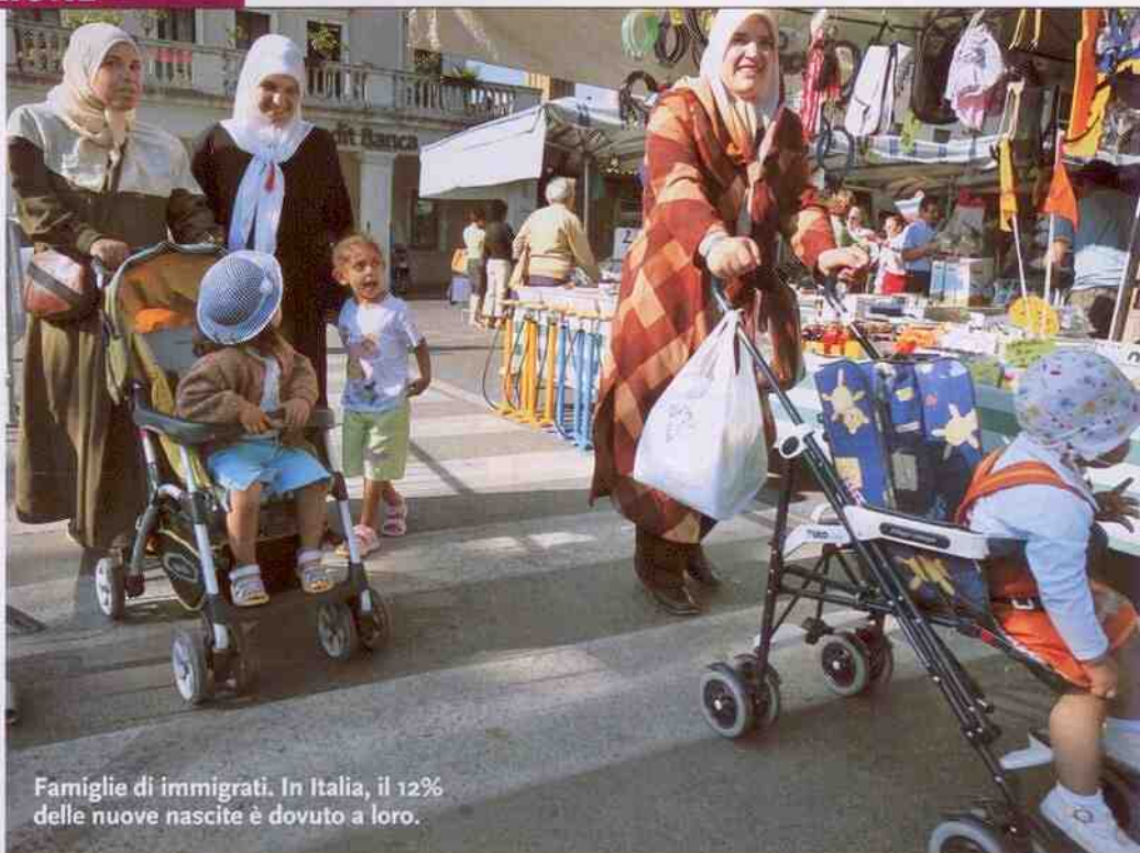
Famiglie di immigrati. In Italia, il 12% delle nuove nascite è dovuto a loro.